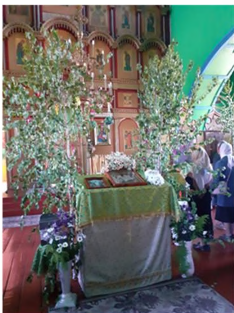
Убранство церкви Святой Живоначальной Троицы в селе Молвино на Троицу в 2022 г.

В церкви Святой Живоначальной Троицы в селе Молвино (оно находится в 5-6 км от села Байдулино) на Святую Троицу полы устилают травой, скошенной в субботу после Богослужения. В этот же день привозят из леса молодые стройные березки и ставят у дверей, вдоль стен, перед солеёй с двух сторон. Украшают деревца разноцветными бумажными лентами. Берёзок много, они выше людей. Трава благоухает. Кажется, что находишься в райском лесу.